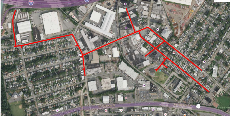
Project map, affected streets highlighted in red (above)